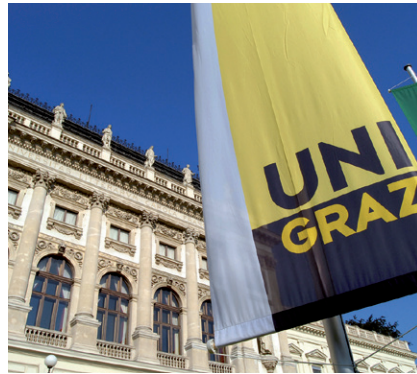
KARL-FRANZENS-UNIVERSITÄT GRAZ

Der/die ArbeitnehmerIn hat der Universität bei Beendigung des Arbeitsverhältnisses die ihm/ihr von der Universität anvertrauten Gegenstände, Apparate, Instrumente, Literatur, dienstlichen Schriftstücke udgl. aufgefördert zurückzugeben.