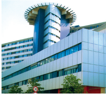
MEDIZINISCHE UNIVERSITÄT INNSBRUCK, CHIRURGIE

(1) Dem/der ArbeitnehmerIn, der/die durch Erklärung bei der Universität einen Pauschbetrag gemäß § 16 Abs. 1 Z. 6 lit. c, d oder e EStG 1988 in Anspruch nimmt, gebührt ab dem Tag der Abgabe dieser Erklärung bei der Universität ein Fahrtkostenzuschuss.