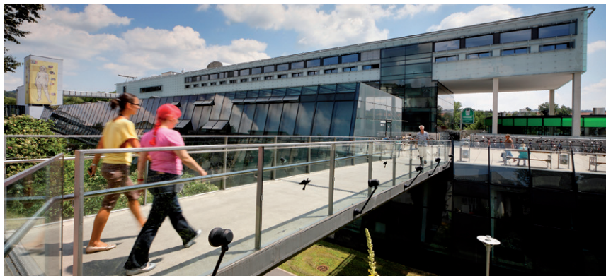
ZENTRUM FÜR MEDIZINISCHE FORSCHUNG (ZMF) DER MEDIZINISCHEN UNIVERSITÄT GRAZ