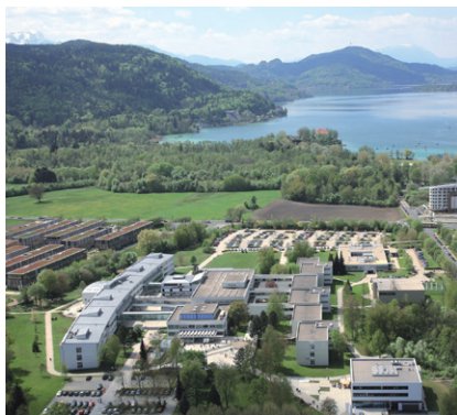
ALPEN-ADRIA-UNIVERSITÄT KLAGENFURT

(3) Zuschläge nach Abs. 1 oder Abs. 2 sind bei der Berechnung des Zuschlages für an Sonntagen oder in der Nacht geleistete Überstunden (§ 55 Abs. 3 Z 2 und 3 lit a bzw lit b) und für Mehrarbeitsstunden (§ 55 Abs. 3 Z 2 lit d) nicht zu berücksichtigen.