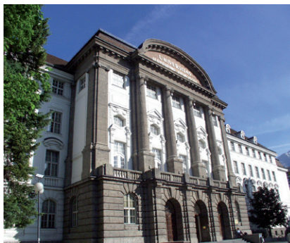
UNIVERSITÄT INNSBRUCK / © Universität Innsbruck

(1) Für wissenschaftliche/künstlerische MitarbeiterInnen, die nach dem 31. Dezember 2003 und vor dem Zeitpunkt des Inkrafttretens dieses Kollektivvertrages in ein Arbeitsverhältnis zur Universität aufgenommen wurden, das im Wesentlichen den Regelungen in §§ 6 ff UniAbgG (insbesondere im Hinblick auf die Einräumung von Zeit für Erbringung selbständiger wissenschaftlicher oder künstlerischer Leistungen sowie für einschlägige Aus- und Fortbildung und die vom Assistent/-innenschema abweichende Entgelthöhe) entspricht, gelten abweichend von §§ 31, 49 und 76 das Beschäftigungsausmaß, die Aufgabenfestlegung sowie das Entgelt, wie im jeweiligen Arbeitsvertrag festgelegt, als zwingender Mindeststandard. Das Entgelt beträgt