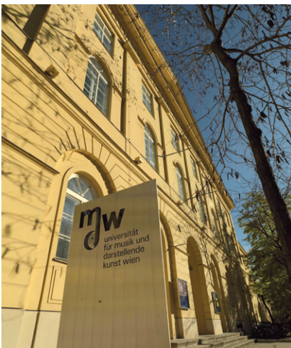
UNIVERSITÄT FÜR MUSIK UND DARSTELLEND KUNST WIEN

(3) Die Vereinbarung des Arbeitszeitmaßes hat nach der Zahl der zu leistenden Semesterstunden und der Art der Lehrver-