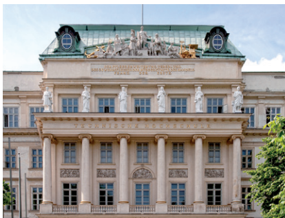
TECHNISCHE UNIVERSITÄT WIEN, HAUPTGEBÄUDE

(2) Abs. 1 ist nicht anzuwenden, wenn die betreffende Person mit einer entsprechenden Kürzung ihres Entgelts einverstanden ist.