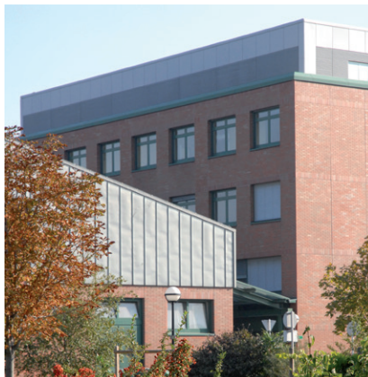
VETERINÄRMEDIZINISCHE UNIVERSITÄT WIEN

(3) Alle ArbeitnehmerInnen der Medizinischen Universitäten und der Veterinärmedizinischen Universität Wien haben an der gemeinsamen Erfüllung der Aufgaben in For-