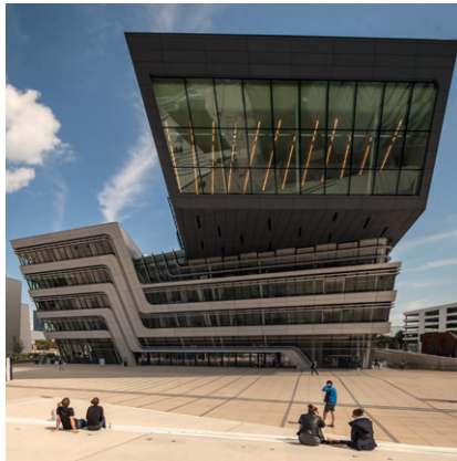
WIRTSCHAFTSUNIVERSITÄT WIEN / © Stephan Huger

(5) Durch Betriebsvereinbarung können geeignete Vorkehrungen zur Vermeidung und Bewältigung von innerbetrieblichem Mobbing getroffen werden.