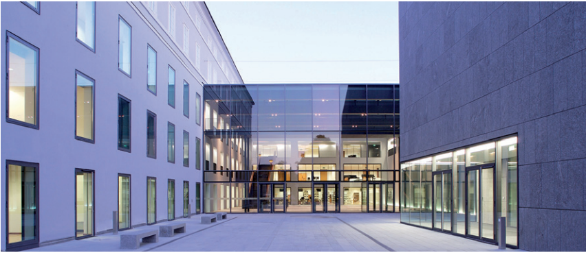
UNIVERSITÄT MOZARTEUM SALZBURG / © Christian Schneider

nen der Veterinärmedizinischen Universität in tierärztlicher Verwendung.