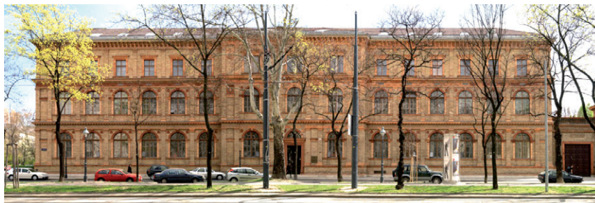
UNIVERSITÄT FÜR ANGEWANDTE KUNST WIEN / © faksimile digital/Kainz

(4) Die/der ArbeitnehmerIn hat Beginn und Dauer des Karenzurlaubes spätestens einen Monat vor dem voraussichtlichen Geburtstermin bzw. vor der Annahme an Kindes Statt oder der Übernahme in unentgeltliche Pflege bekanntzugeben und in weiterer Folge die anspruchsbegründenden und anspruchsbefreienden Umstände darzulegen. In dieser Zeit bleibt der bisherige Sozialver-