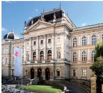
TECHNISCHE UNIVERSITÄT GRAZ, HAUPTGEBÄUDE, ALTE TECHNIK

Dabei sind alle Zeiten in einem Arbeitsverhältnis bei der jeweiligen Universität zu berücksichtigen, die mindestens zusammenhängend je sechs Monate gedauert haben. Abs. 7 bleibt davon unberührt.