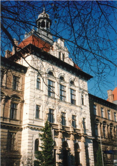
UNIVERSITÄT FÜR BODENKULTUR, MENDEL HAUS

KA-AZG (§ 40 Abs. 7 und 8), mit der das Funktionieren des Krankenanstaltenbetriebes (§ 37 Abs. 1) gewährleistet ist, auf monatlich 22,5 % des monatlichen Bruttoentgeltes der Verwendungsgruppe IIIb/ Regelstufe 1 (§ 54). Bei Teilzeitbeschäftigung gebührt die Zulage aliquot.