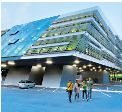
JOHANNES KEPLER UNIVERSITÄT LINZ, SCIENCE PARK

(1) Durch Betriebsvereinbarung kann allen ArbeitnehmerInnen nach jeweils sieben-Jahren ununterbrochener Beschäftigung bei der betreffenden Universität ein Anspruch auf Freistellung von der Arbeitsleistung mit oder ohne Fortzahlung des Entgelts für Weiterbildungszwecke im Höchstausmaß von jeweils zwei Monaten eingeräumt werden. § 33 bleibt unberührt.