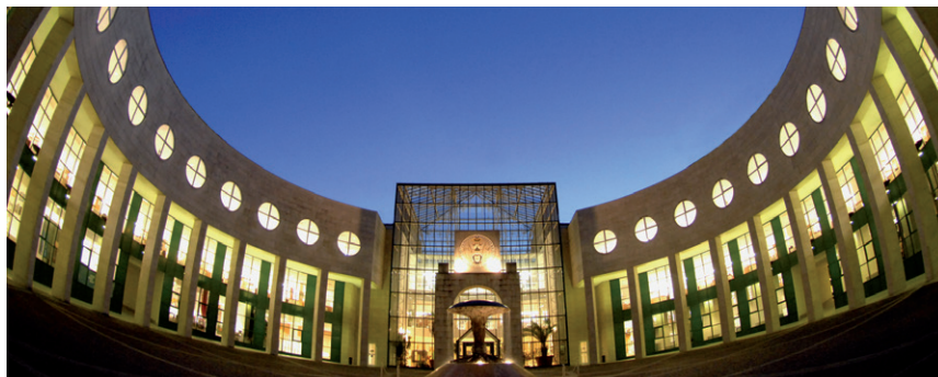
UNIVERSITÄT SALZBURG