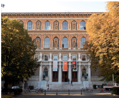
AKADEMIE DER BILDENDEN KÜNSTE WIEN