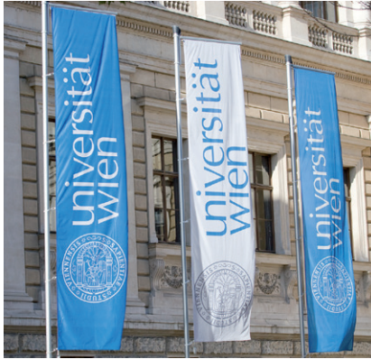
UNIVERSITÄT WIEN, HAUPTPORTAL