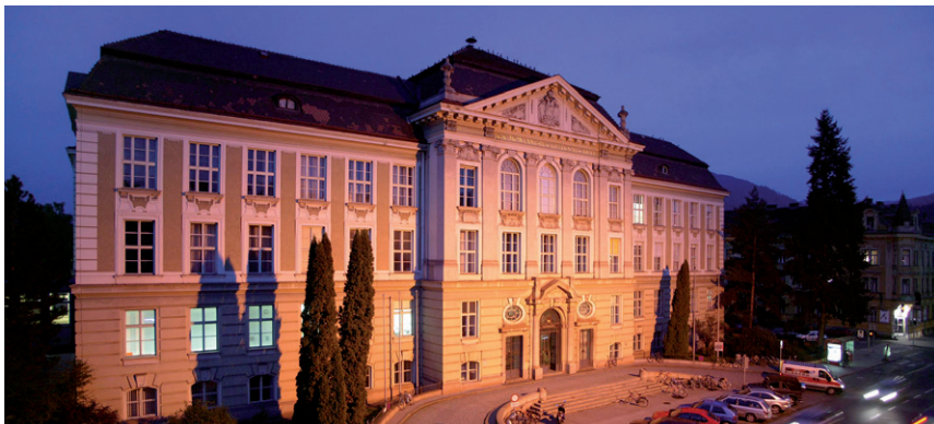
MONTANUNIVERSITÄT LEOBEN / © Montanuniversität/Freisinger

barten Indexzahl ergibt, wobei Änderungen solange nicht zu berücksichtigen sind, als sie 5 % dieser Indexzahl und in der Folge 5 % der zuletzt für die Valorisierung maßgebenden Indexzahl nicht übersteigen. Die neuen Beträge gelten ab dem der Verlautbarung der Indexveränderung durch die Bundesanstalt Statistik Österreich folgenden übernächsten Monatsersten. Maßgebend sind die durch Verordnung des Bundeskanzlers gemäß § 20b Abs. 2 des Gehaltsgesetzes 1956 kundgemachten durch die Valorisierung geänderten Beträge einschließlich des Zeitpunkts, in dem deren Änderung wirksam wird.