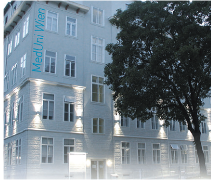
MEDIZINISCHE UNIVERSITÄT WIEN

(3) Die Leistung von Überstunden ohne ausdrückliche Anordnung ist nur in außergewöhnlichen Fällen zulässig. Der/die ArbeitnehmerIn ist verpflichtet, diese Überstundenleistung dem/der unmittelbaren