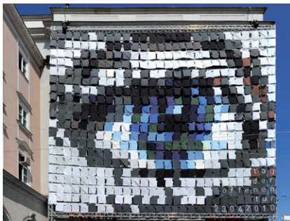
KUNSTUNIVERSITÄT LINZ (EYECATCHER – FASSADEN- GESTALTUNG ZUM TAG DER OFFENEN TÜR 2010)

anstellung zu erfolgen, wobei eine Semesterstunde im Durchschnitt 15 Einheiten (die davon abweichend durch den jeweiligen Senat nach § 52 UG festgelegte Zahl von Unterrichtswochen) zu je 45 Minuten umfasst. Für die Festlegung der Art der Lehrveranstaltung ist nach dem mit dieser (einschließlich der jeweils dazugehörigen Tätigkeiten nach Abs. 4) verbundenen Aufwand zu differenzieren und können Lehrveranstaltungskategorien gebildet werden. Dabei darf