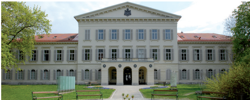
KUNSTUNIVERSITÄT GRAZ, PALAIS MERAN / © KUG/Wenzel