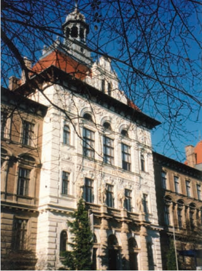
UNIVERSITÄT FÜR BODENKULTUR, MENDEL HAUS