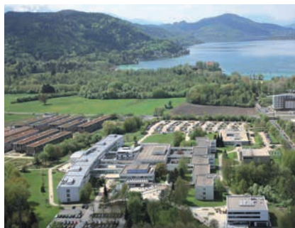
ALPEN-ADRIA-UNIVERSITÄT KLAGENFURT / © uniklu

(3) § 54 Abs. 2 und 3 sowie § 55 gelten auch für Lehrlinge und FerialarbeitnehmerInnen.