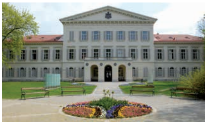
KUNSTUNIVERSITÄT GRAZ, PALAIS MERAN

zulässig, wenn dies in der Ausschreibung vorgesehen ist und eine der folgenden Voraussetzungen vorliegt: