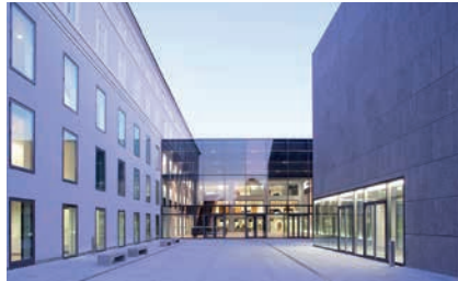
UNIVERSITÄT MOZARTEUM SALZBURG / © Christian Schneider

ArbeitnehmerInnen nach § 26, die im Klinischen Bereich einer Medizinischen Univer-