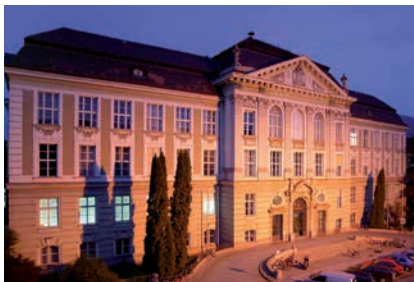
MONTANUNIVERSITÄT LEOBEN

(10) Die Vorschriften der Abs. 1 bis 9 gelten rückwirkend ab 1. 10. 2009. Für ArbeitnehmerInnen, die bis 31. 10. 2009 einen Antrag auf Fahrtkostenzuschuss samt den erforderlichen Nachweisen gestellt haben, gelten bis 31.12.2009 die Vorschriften dieses Kollektivvertrages in seiner Stammfassung, wenn und solange die dort vorgesehenen Voraussetzungen erfüllt sind und der Fahrtkostenzuschuss nicht geringer ist als der sich nach Abs. 1 bis 9 ergebende Betrag.