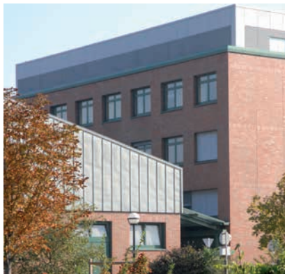
VETERINÄRMEDIZINISCHE UNIVERSITÄT WIEN

ProjektmitarbeiterInnen (§ 28) dürfen als Ärzte/Ärztinnen in Facharzt Ausbildung nur nach Maßgabe der ärztlichen Ausbildungsvorschriften eingesetzt werden. Für sie gelten die Bestimmungen des § 44.