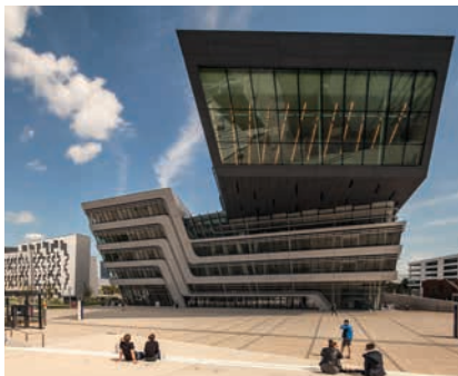
WIRTSCHAFTSUNIVERSITÄT WIEN / © Stephan Huger

zu erörtern. Auf Verlangen des Arbeitnehmers/der Arbeitnehmerin oder des Leiters/der Leiterin der Organisationseinheit (des/der verantwortlichen bzw. mit der Fachaufsicht betrauten Vorgesetzten) ist ein Mitglied