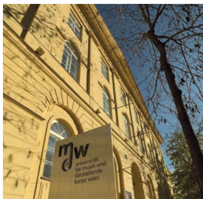
UNIVERSITÄT FÜR MUSIK UND DARSTELLEND KUNST WIEN / © Michael Maritsch

(1) Studentische MitarbeiterInnen sind teilzeitbeschäftigte ArbeitnehmerInnen nach § 5 Abs. 2 Z. 1, die bei Abschluss des Arbeitsvertrages ein für die in Betracht kommende Verwendung vorgesehenes Master-(Diplom-) Studium noch nicht abgeschlossen haben. Sie haben nach Maßgabe des Arbeits-