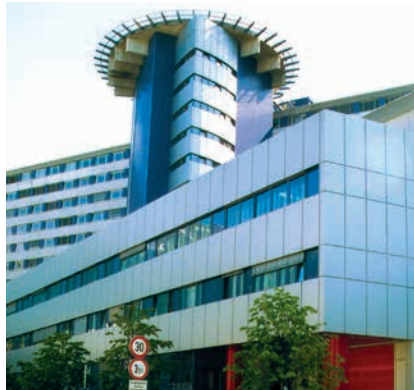
MEDIZINISCHE UNIVERSITÄT INNSBRUCK, CHIRURGIE

(7) Fahrtkostenzuschüsse, die aufgrund einer unvollständigen oder fehlerhaften Meldung oder einer Verletzung der Verpflichtungen