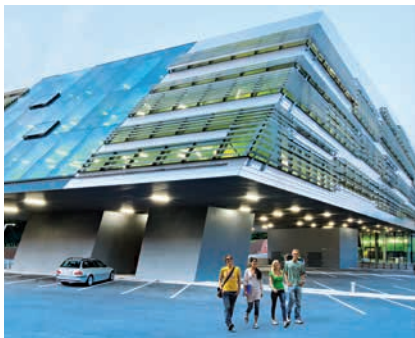
JOHANNES KEPLER UNIVERSITÄT LINZ, SCIENCE PARK

Qualifizierungsvereinbarung: acht Semesterstunden;