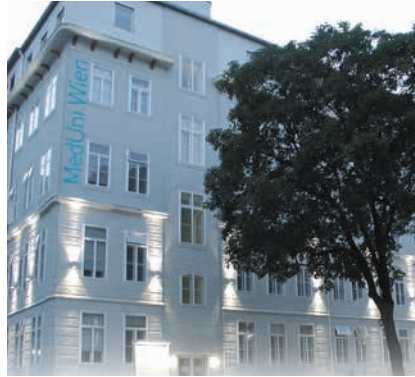
MEDIZINISCHE UNIVERSITÄT WIEN