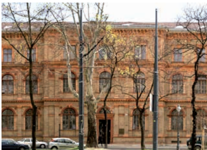
UNIVERSITÄT FÜR ANGEWANDTE KUNST WIEN / © faksimile digital/Kainz

(1) Ein befristetes Arbeitsverhältnis endet mit Ablauf der Zeit, für die es eingegangen wurde. Eine vertragliche vereinbarte Kündigungsmöglichkeit ist bei Befristungen von bis zu zwei Jahren rechtsunwirksam. Bei längeren Befristungen kann eine Kündigung erst