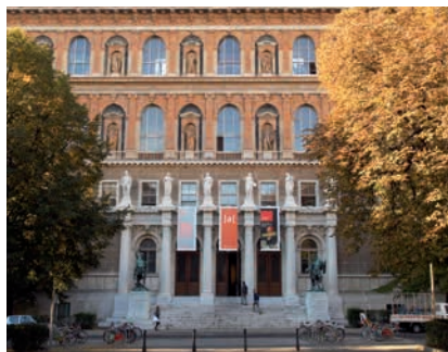
AKADEMIE DER BILDENDEN KÜNSTE WIEN © Lisa Rastl