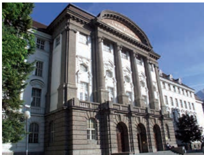
UNIVERSITÄT INNSBRUCK / © Universität Innsbruck

Beitragszahlungen vorübergehend aussetzen oder einschränken, wenn zwingende wirtschaftliche Gründe vorliegen.