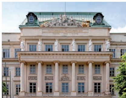
TECHNISCHE UNIVERSITÄT WIEN, HAUPTGEBÄUDE

(2) Abs. 1 ist nicht anzuwenden, wenn die betreffende Person mit einer entsprechenden Kürzung ihres Entgelts einverstanden ist.