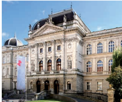
TECHNISCHE UNIVERSITÄT GRAZ, HAUPTGEBÄUDE, ALTE TECHNIK

jeweiligen Universität in einem Arbeitsverhältnis (ausgenommen als Lehrling oder studentische/r MitarbeiterIn) beschäftigt waren: 28 Arbeitstage,