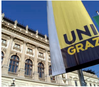
KARL-FRANZENS-UNIVERSITÄT GRAZ

1. ein Bedarf entsprechend der internen Strukturplanung (§ 27 Abs. 1) gegeben ist;