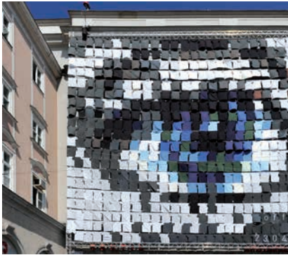
KUNSTUNIVERSITÄT LINZ (EYECATCHER – FASSADEN- GESTALTUNG ZUM TAG DER OFFENEN TÜR 2010) © Violetta Wakolbinger, Helga Traxler

vertrages bei Lehrveranstaltungen, bei wissenschaftlichen/künstlerischen Arbeiten, bei der Betreuung von Studierenden, bei Verwaltungstätigkeiten und bei der Durchführung von Evaluierungsmaßnahmen sowie an Medizinischen Universitäten oder der Veterinärmedizinischen Universität auch an klinischen Hilfstätigkeiten nach Maßgabe der berufsrechtlichen Vorschriften nach Anweisung ihres/ihrer Dienstvorgesetzten mitzuwirken.