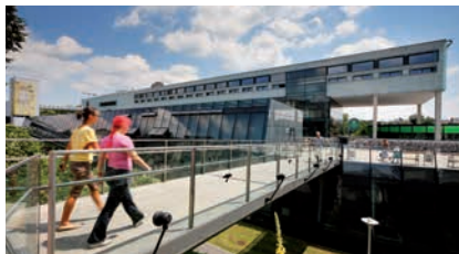
ZENTRUM FÜR MEDIZINISCHE FORSCHUNG (ZMF) DER MEDIZINISCHEN UNIVERSITÄT GRAZ

wird kaufmännisch auf die erste Dezimalstelle gerundet. Berechnungsgrundlage für diese Erhöhung ist das Dezembergehalt 2009.