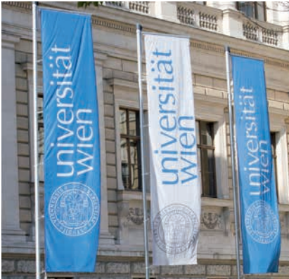
UNIVERSITÄT WIEN, HAUPTPORTAL